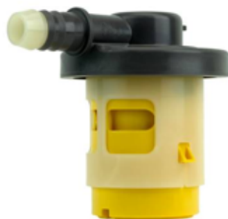
Produto fabricado: válvula de ventilação